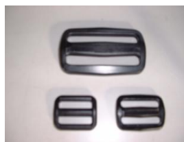
ベルト留め T-25・38・50 1段につき2ヶ