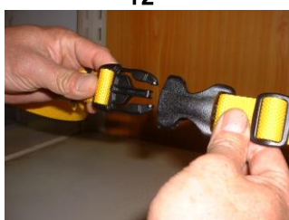
バックルをはめる