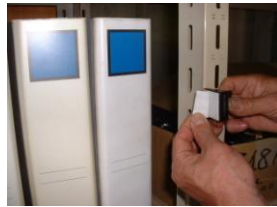
2. 両面テープで剥がす