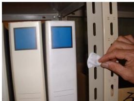
1. クリーナーで拭く