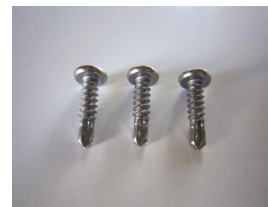
ドリルビス φ4×16 1段につき4本