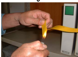
カット部はライター等で熱して