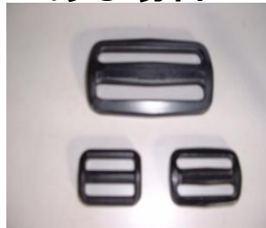
ベルト留め T-25・38・50 1段につき4ヶ