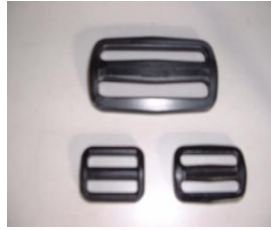
ベルト留め T-25・50 1段につき2ヶ