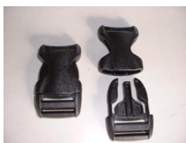
ワンタッチバックル LB-25・38・50 1段につき1ヶ