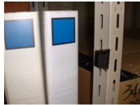
3. 接着する(圧着する)