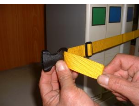
9. バックルの片側を通す