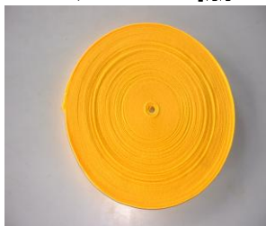
ベルト 25mm・38mm・50mm 1段につき必要尺