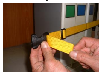
バックルの片側を通す