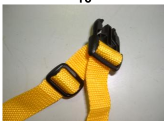
ベルトはこのように通す