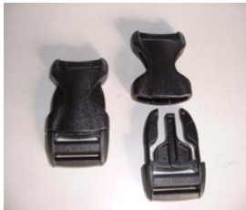
ワンタッチバックル LB-25・50 1段につき1ヶ