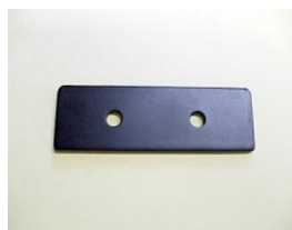
平金具 373-S 1段につき2枚