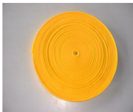
ベルト 25mm・50mm 1段につき必要尺