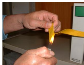
7. カット部はライター等で加熱してください