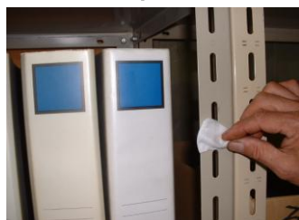
クリーナーで拭く