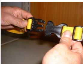
14. バックルをはめる