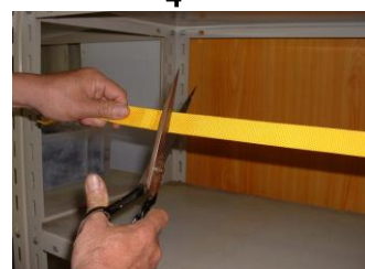
中心部より多目にしてカット