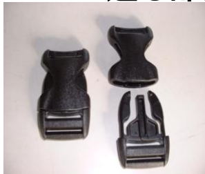
ワンタッチバックル LB-25・38・50 1段につき1ヶ