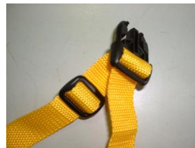
12. ベルトはこのように通す