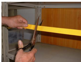
6. 中心部より多めにカット