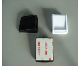
ベルト留め(両面テープ) ST25(白・黒) ST50(黒) 1段につき2ヶ