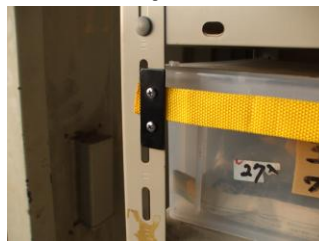
ビス裏面,突起に注意