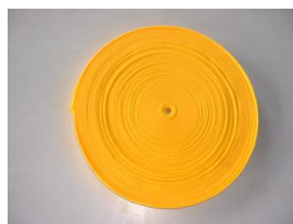
ベルト 25mm・38mm・50mm 1段につき必要尺