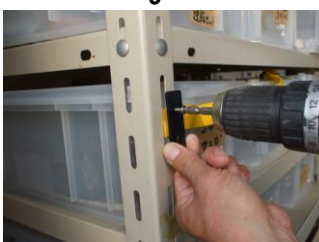
反対側も同じように