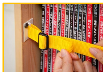
もう片方も同様に取り付けます

※直接木製棚にビスを打つと木が割れてしまう事があります。必ず下穴を開けてからビスを打ってください。