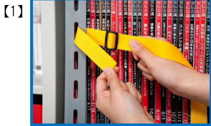
Lアングル棚にベルトを通します