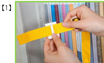
接着金具にベルトを通します