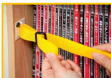
ベルト留めに戻します