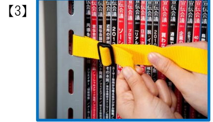
片方も同様に取り付けます