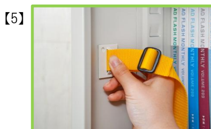
もう片方も同様に取り付けます。

※十分な効力が発揮されるよう凸凹の大きい面には使用しないでください ※接着後72時間以内は無理に引っ張らないでください