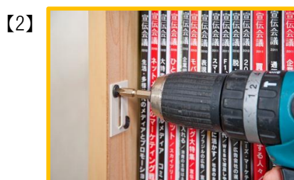
金具をビスで固定してください