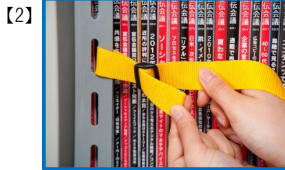
ベルト留めに戻します。