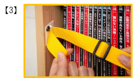
金具にベルトを通します