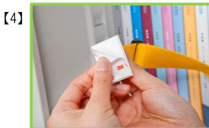
保護紙を取り棚側面に接着してください